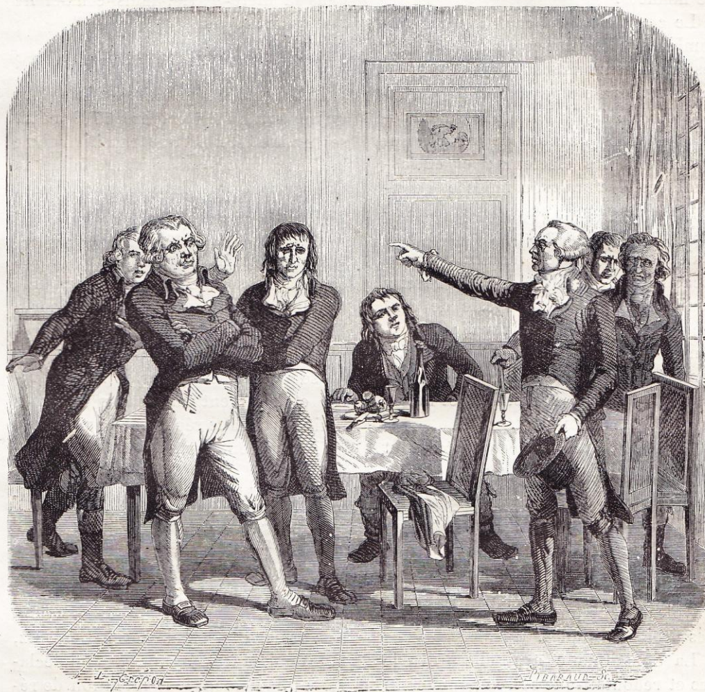
Entrevue de Danton et de Robespierre.

l'Assemblée qui soupirait après la retraite, le roi l'accepta solennellement le 14 septembre et fut rétabli dans ses pouvoirs ou du moins dans l'ombre de ses pouvoirs, car il avait à jamais perdu son autorité morale, et il n'avait pas la force de volonté d'imposer à son entourage le respect des nouvelles lois.